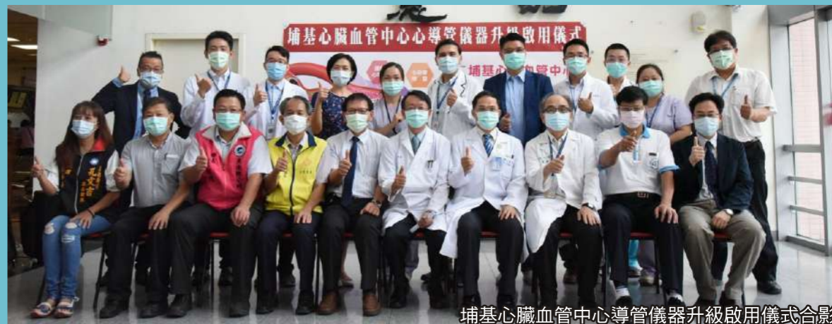
埔基心臟血管中心導管儀器升級啟用儀式合影

埔基秉持愛鄰如己的院訓，為持續全方位照顧大埔里民眾的健康而努力，今年7月30日起心臟血管中心更換最新『雙向數位平板心血管X光攝影機設備』，提供3D立體影像讓檢查更精準，提供大埔里地區民眾能有更好的心臟血管介入治療。且完成大埔里地區首例緊急脾臟血管栓塞救治，挽救病人免於脾臟摘除，保留脾臟持續正常造血、儲血及免疫功能，使病人獲得完整治療。