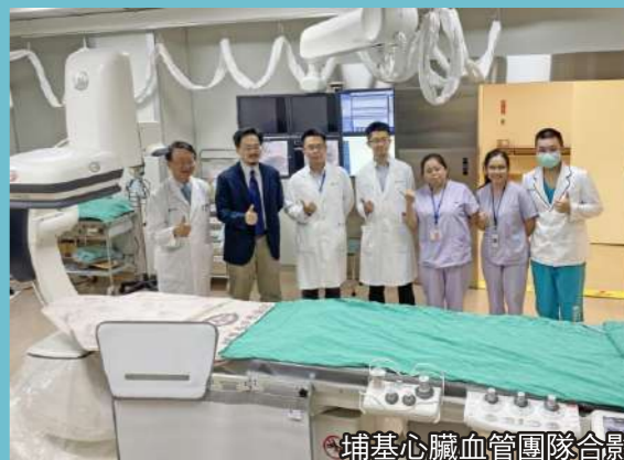
埔基心臟血管團隊合影

陪伴埔基影像醫學科13年的磁振造影(MRI)，將於12月28日起全面更新升級最新「MRI磁共振」系統與設備，能更快速且精準檢查判讀腦、脊椎的神經與血管造影，即時解決偏鄉醫療救治。