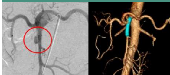
透過覆膜支架置放治療剝離性動脈瘤。

另一收治個案為患有高血壓的50歲上班族，因突發劇烈腹痛、腹脹緊急至光田急診，經檢查確診為少見的「上腸繫膜動脈剝離性動脈瘤」，恐有腸缺血壞死或動脈瘤破裂致出血症休克死亡的風險。