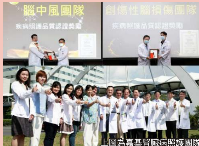
上圖為嘉基腎臟病照護團隊

嘉基為提升腦中風治療品質，2007年即成立「腦中風中心」並曾以「提升急性缺血性中風照護品質」獲得醫策會「醫療品質改善突破系列貢獻獎」、「最佳標竿團隊」；在腦中風的急性治療到急性後期照護，皆獲得SNQ?國家品質標準的肯定，並且在2018年榮獲衛生福利部「組合式照護品質績優獎」。