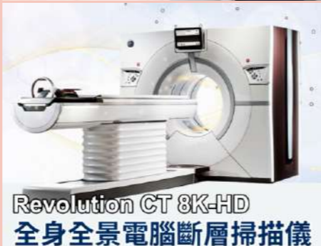
Revolution CT 8K-HD 全身全景電腦斷層掃描儀