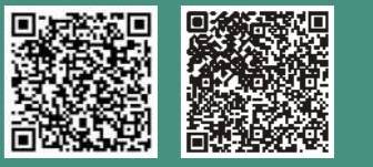
影片QR CODE 線上發聲QR CODE

新竹馬偕的兒科及婦產科專業團隊，期盼為新生兒健康做出更多的努力和貢獻，繼續成為竹苗地區早產兒及急重症新生兒的守護者。